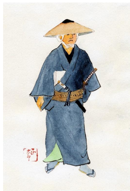
長谷川平蔵市中見回りの図